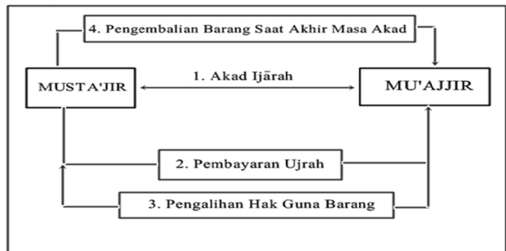
Skema 1 transaksi ija>rah dengan objek manfaat barang 14

Di dalam teknis perbankan ija>rah adalah akad atau perjanjian antara bank dengan nasabah untuk menyewa suatu barang atau cek milik bank, dimana bank mendapatkan imbalan atas barang yang disewakannya, dan diakhiri periode nasabah membeli barang atau objek yang disewakan. Pengalihan pemilikan akad yang diadakan di awal, hanya semata-mata untuk memudahkan bank dalam pemeliharaan aset itu sendiri baik sebelum dan sesudah berakhirnya sewa. 13