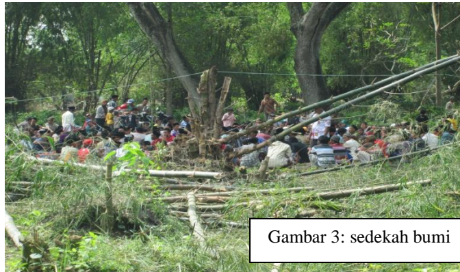
Gambar 3: sedekah bumi

Tujuannya diadakan ritual sedekah bumi terutama untuk mensyukuri nikmat yang telah diberikan oleh Tuhan dan memohon kepada-Nya supaya nikmat yang lebih baik dilimpahkan di tahun depan, selain itu dimaksudkan untuk menghindari rasa akan terjadinya kemungkinan dampak yang buruk baik kehidupan masyarakat penduduk Sembunglor terutama dalam hal pertanian. Oleh karena itu, dalam kepercayaan dengan adat secara tradisional, masyarakat Jawa juga mengenal roh yang menitis inkarnasi atau nurun. Kepercayaan ini agaknya hanya orang tua saja atau mereka yang dianggap berpikiran kuno saja yang hingga kini mempercayainya. Dipercayai bahwa roh nenek moyang yang sudah meninggal dapat menitis atau menurun kepada masyarakat sampai seterusnya mulai anak sampai cucu-cucu.