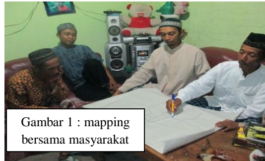
Gambar 1 : mapping bersama masyarakat