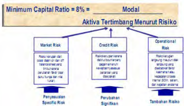
Tabel 2 (Kecukupan Modal)

Framework kecukupan permodalan yang baru pada Manajemen Risiko lebih fleksibel dengan memberikan sejumlah pendekatan yang sensitif terhadap risiko dan insentif bagi