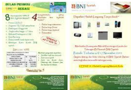
Gambar 3.1 Pers Release pada berbagai media

Agar semua strategi dapat berjalan dengan baik dan sesuai yang diharapkan Lies Harini (operasional) ini menjelaskan hal yang perlu diperhatikan dalam tahapan pelaksanaannya