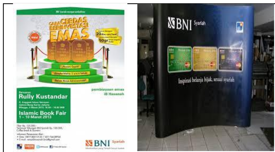
Gambar 3.2 Periklanan yang dilakukan oleh PT BNI Syariah Cabang Dharmawangsa Surabaya

Dalam hal ini PT BNI Syariah Cabang Dharmawangsa Surabaya melakukan outdoor promotion dan indoor promotion sebagai usaha menarik minat pengunjung seperti dapat diperhatikan pada gambar berikut :