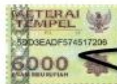
(MUSTA'IN SALIM) D71213123